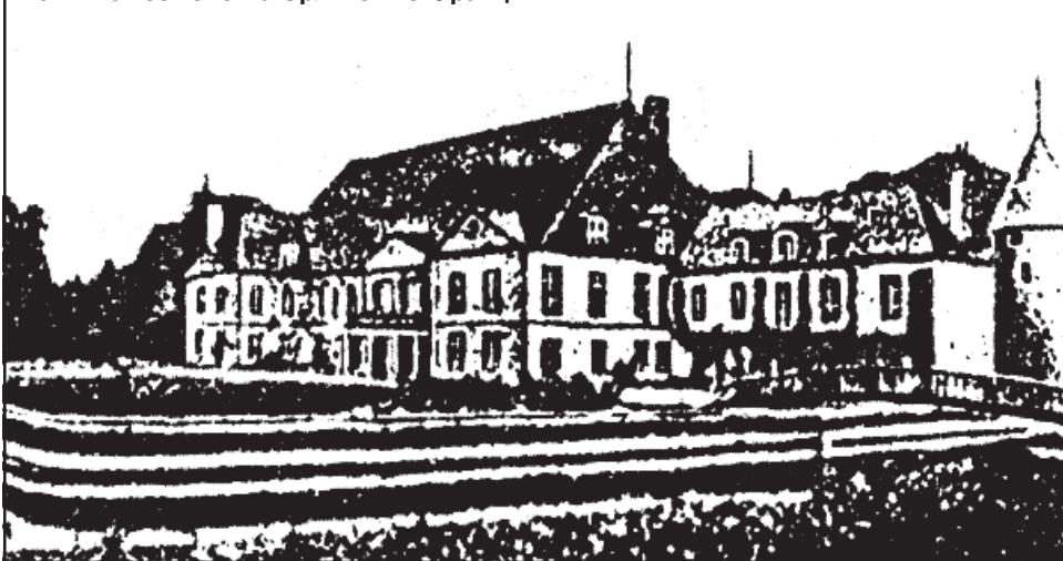
«Хатынка» семейства Орликов во Франции

дило превращение Украины в буферную зону между Европой и Россией. Такую же цель ставила и Турция. Подтверждает этот факт и О. Субтельный: «Именно этого и не мог осознать Орлик и оценить эти изменения в политике Порты, так как турецкие деятели в начале XVIII ст. рассматривали Украину... больше как буфер против российской экспансии, чем придаток к Османской империи» (О. Субтельный, там же, стр. 93). Такая же стратегия в отношении Украины проводится и современной европейской дипломатией - спустя 300 лет!